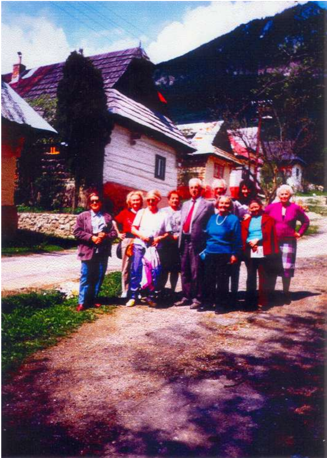
Exkurzia seniorov vo Vlkolínci v roku 1995 ( Zoskupenie ľudových stavieb zaradené do zoznamu Svetového kultúrneho a prírodného dedičstva UNESCO )