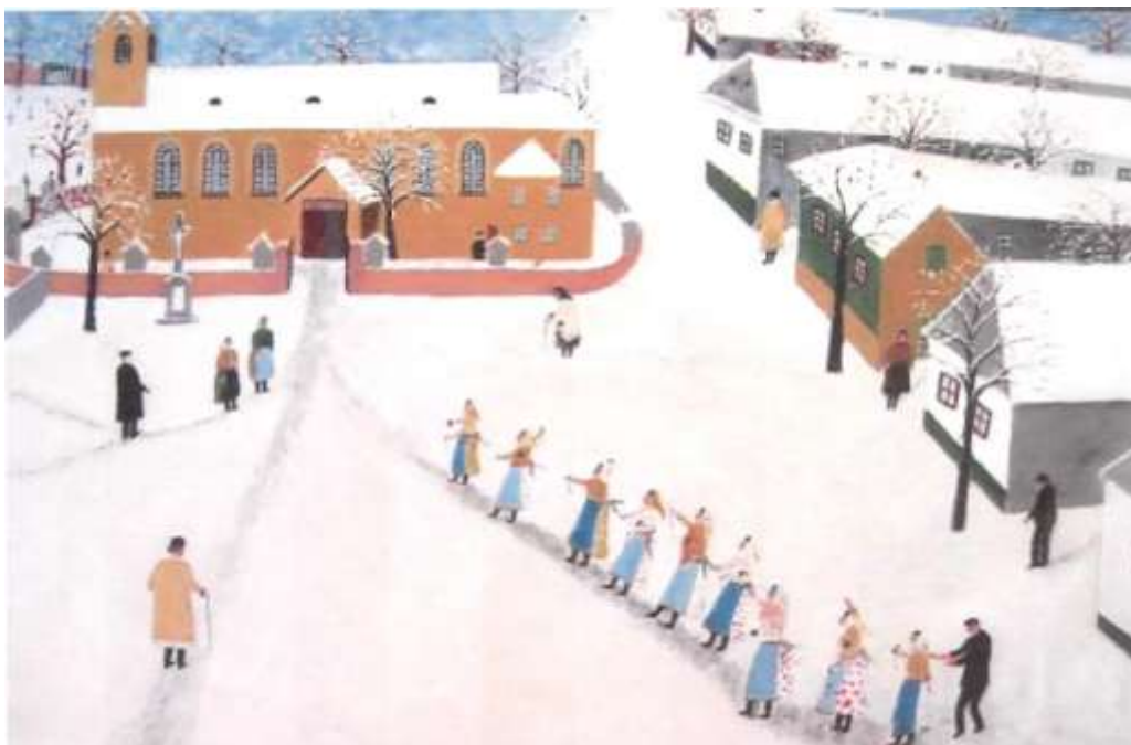
Novoročná klzáčka II., olej z r. 1988