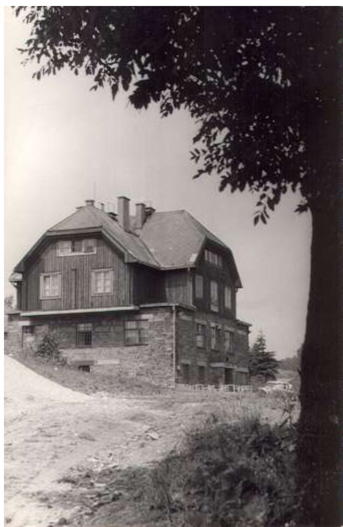
Holubeho chata pod vrcholom Vel'kej Javoriny (+970m)