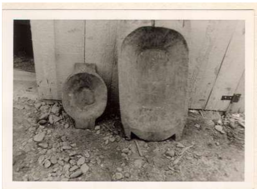
Drevené korytá na prípravu chlebového cesta Zlaté (okres Bardejov ) S. Dillnbergerová, 1986