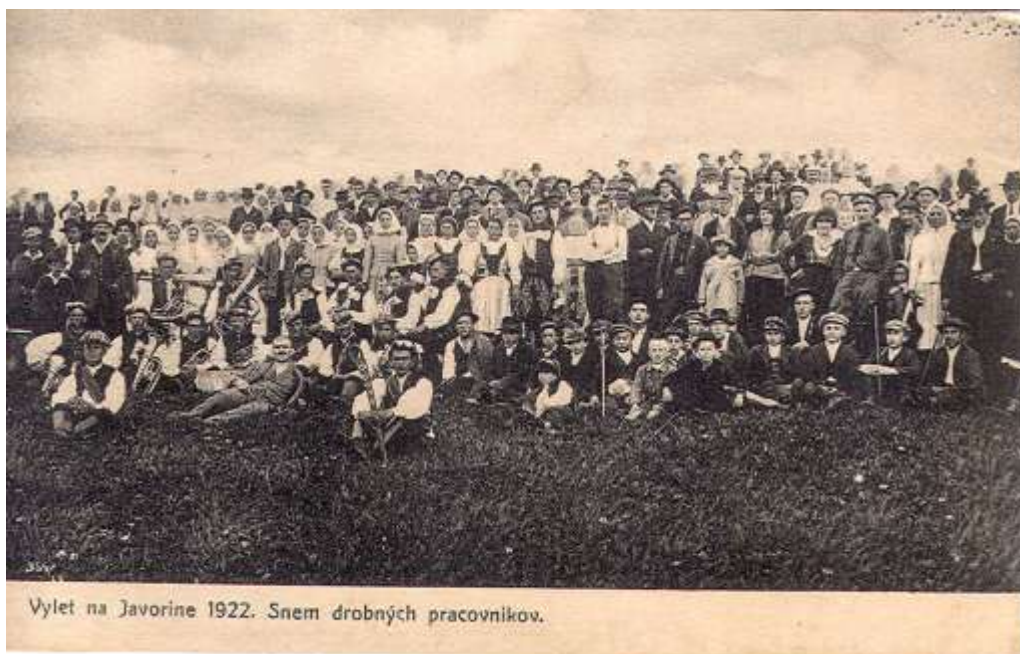
Výlet na Javorine 1922.