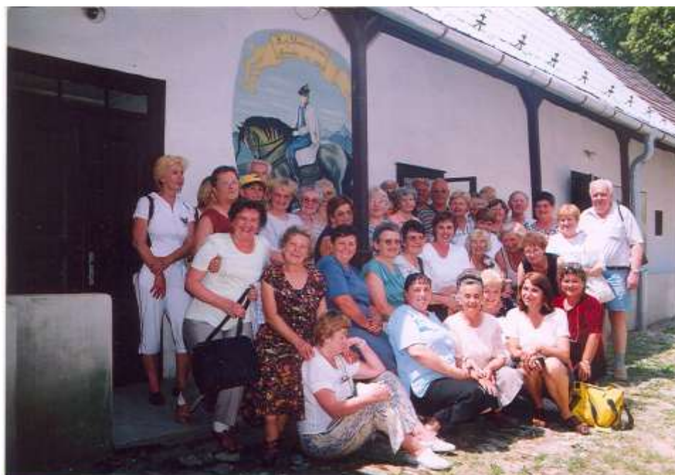
Poslucháči UTV (2003) na dvore bývalej event. a.v. fary, v ktorej v rokoch 1921 – 1929 žil a pracoval Martin Rázus. (Dnes je tu Dom ľudovej kultúry, ktorý bol zriadený pri príležitosti 600-stého výročia prvej písomnej zmienky o obci Moravské Lieskové 1398 – 1998.)