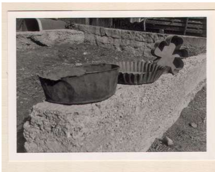
Plechý na pečenie koláčov. Banské (Vranov nad Topľou) S. Dillnbergerová, 1987