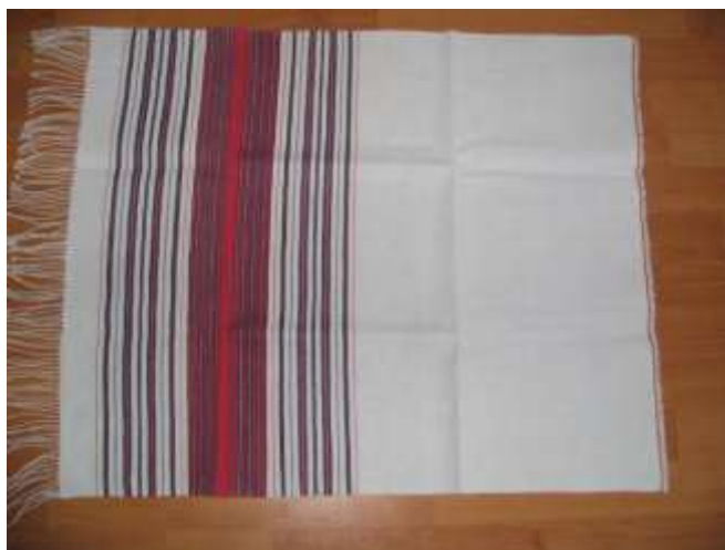
„Podchlebák“. Moravské Lieskové 1900 - 1920