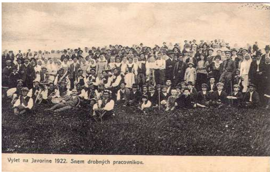
Výlet na Javorine 1922. Snem drobných pracovníků.