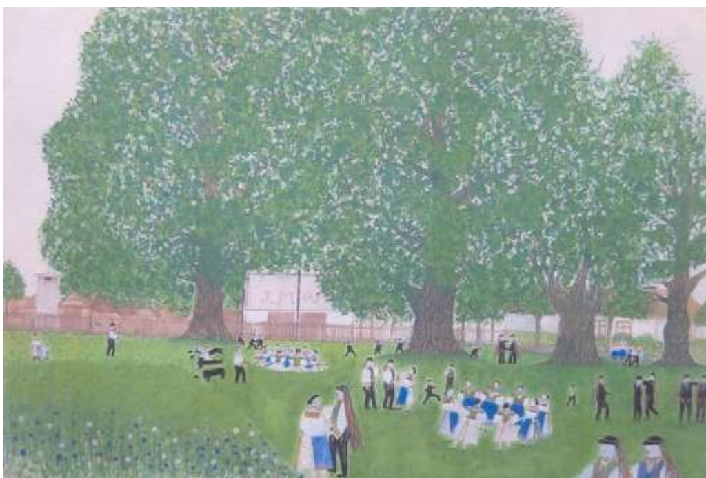
Šuty, akvarel z r. 1952